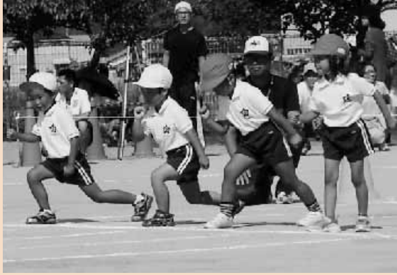
(ゴールめざして走るよ)