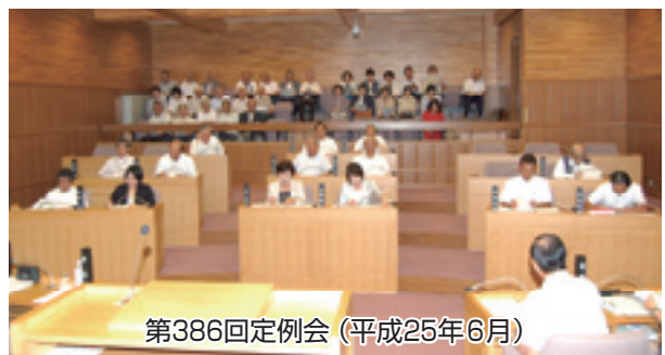
第386回定例会(平成25年6月)