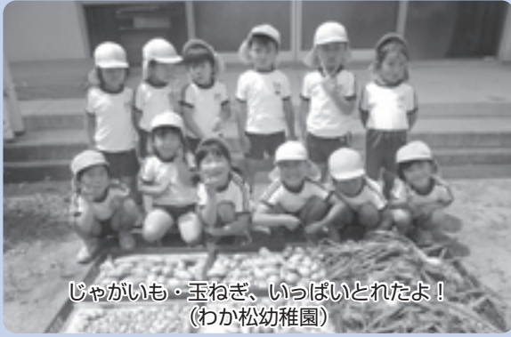
じゃがいも・玉ねぎ、いっぱいとれたよ！ (わか松幼稚園)