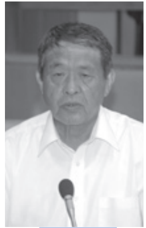
日本共産党 藤原 章 議員