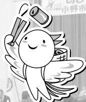
きれいな街いっぱい運動