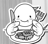
まごころいっぱい運動