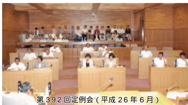
第392回定例会(平成26年6月)