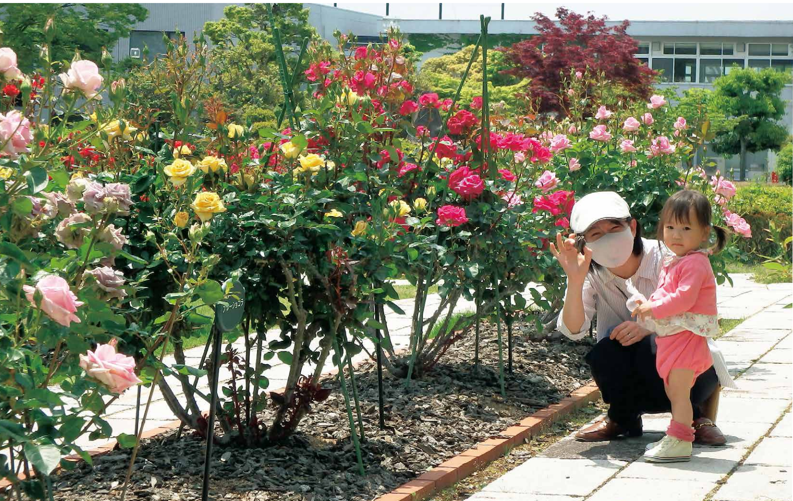
大池総合公園市民広場『ローズガーデン』