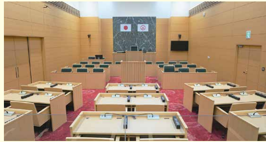
傍聴席から見た議場

小野市議会では、本会議を一般公開しています。当日受付で、住所・氏名を記入するだけで、どなたでも議会の傍聴ができます。 市役所6階 議会事務局までお越しください。