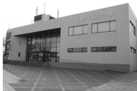
小野商工会議所が小野市伝統産業会館の指定管理者になり、管理・運営を本年4月から5年間行うことになりました。

議会の意思決定は、最終的には本会議で決められますが、効率的、専門的に審議するため、少数の議員で構成する委員会を設けています。委員会では、それぞれの案件を審議し、委員会としての結論を得て、本会議で報告します。