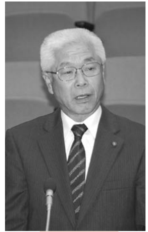
日本共産党 鈴木 垣 元議員