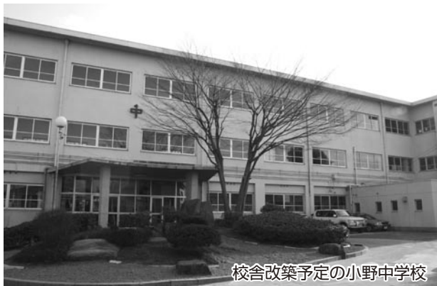
校舎改築予定の小野中学校

今回の補正は、小野中学校校舎改築の早期着工(当初計画では、平成22年度着工予定を、平成21年度に前倒し)のための工事車両進入路の整備等の周辺の整備をはじめ、要介護認定業務変更に伴うシステム改修等の介護保険特別会計への繰出し、国重要文化財である浄土寺黒漆蝶形三足卓(じょうどうじ こくしつちょうがたみつあししよく)の修理にかかるとの補助等の補正を行うものです。