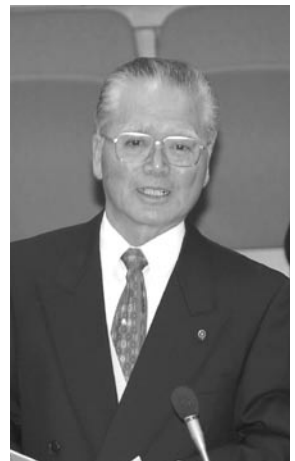
新生クラブ 井上 日吉議員