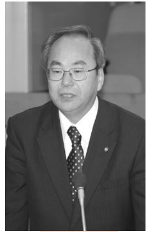
公明党 川名善三議員