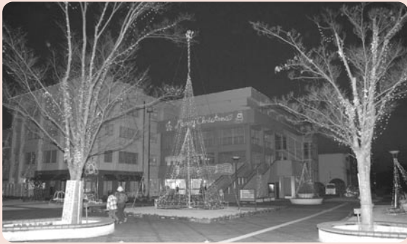
(一般質問・質疑は発言した議員が編集しました)